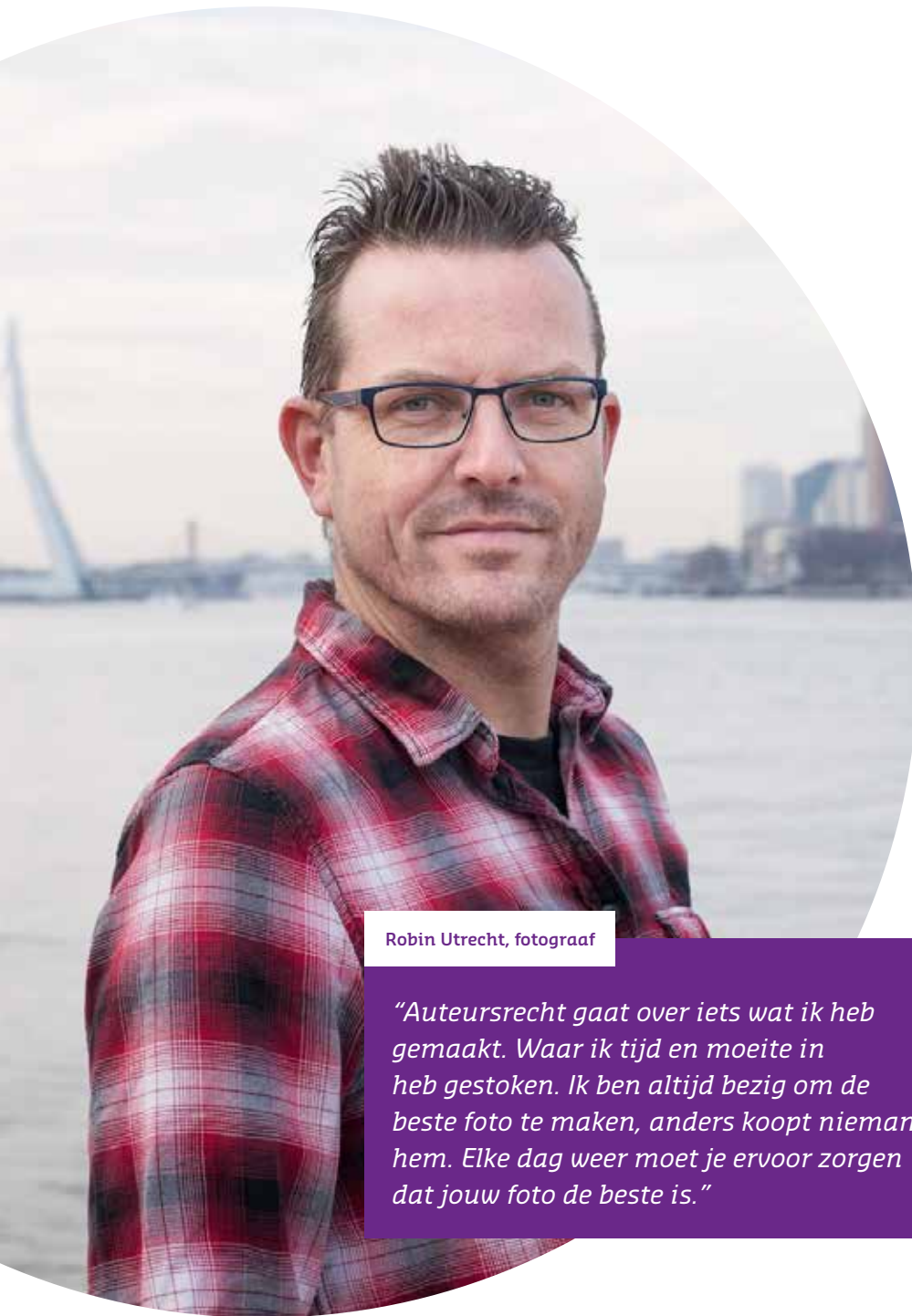
Robin Utrecht, fotograaf

“Auteursrecht gaat over iets wat ik heb gemaakt. Waar ik tijd en moeite in heb gestoken. Ik ben altijd bezig om de beste foto te maken, anders koopt niemand hem. Elke dag weer moet je ervoor zorgen dat jouw foto de beste is.”